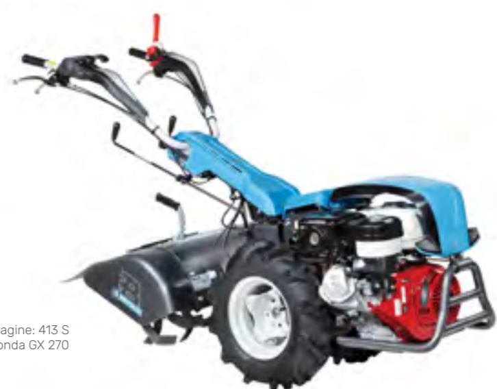
Nell'immagine: 413 S con motore Honda GX 270

OPPURE 12 RATE DA 358,25 € TASSO ZERO TAN 0% TAEG 0%