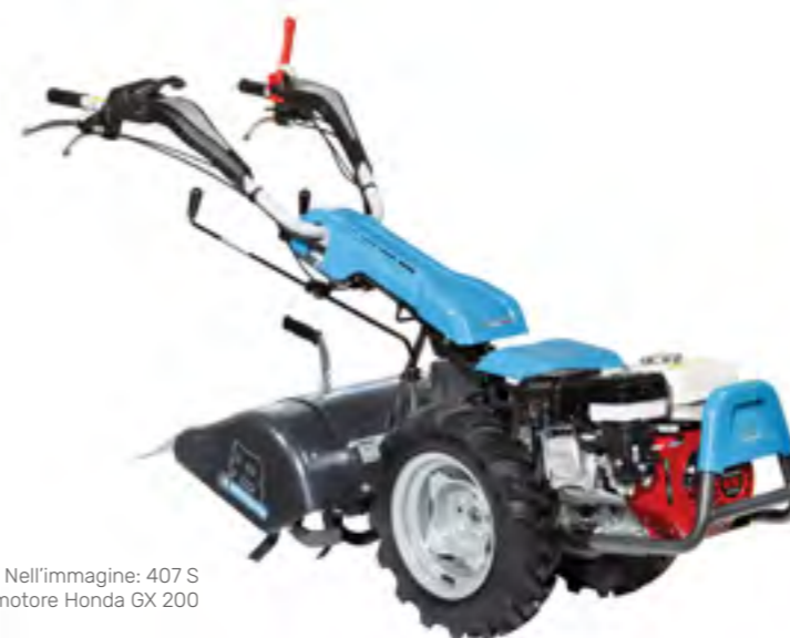
Nell'immagine: 407 S con motore Honda GX 200

OPPURE 12 RATE DA 299,92 € TASSO ZERO TAN 0% TAEG 0%